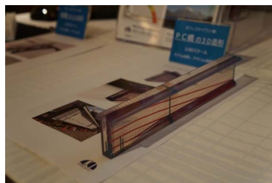
写真：弊社ブースの様子